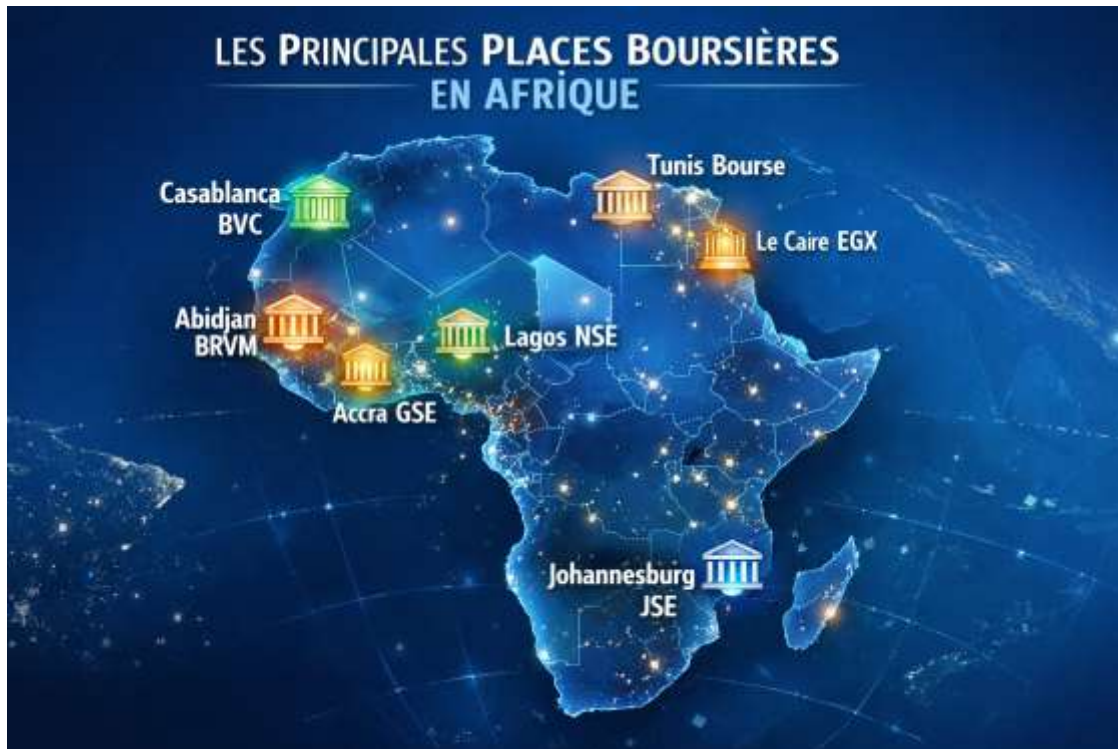
Figure 2 : Les Principales Places Boursières en Afrique

La BRVM est une bourse unique pour huit pays de l'Union Économique et Monétaire Ouest-Africaine (UEMOA) : Bénin, Burkina Faso, Côte d'Ivoire, Guinée-Bissau, Mali, Niger, Sénégal et Togo. Basée à Abidjan, elle permet aux entreprises de ces pays de lever des capitaux et aux investisseurs d'acheter et de vendre des titres [4].