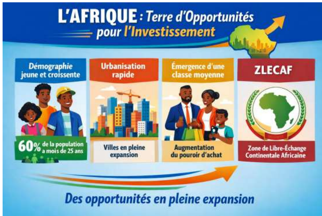
Figure 1 : L'Afrique : Terre d'Opportunités pour l'Investissement

L'Afrique est un continent de 54 pays, chacun avec ses propres dynamiques, mais partageant des tendances macroéconomiques et démographiques communes qui en font un pôle d'attraction pour l'investissement [1].